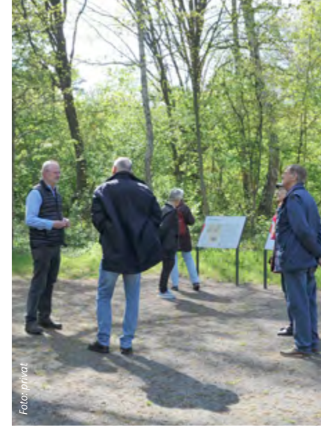
Besuch der Außenstelle des KZ Neuengamme.

Die Sonnenwende wird am 20. Juni im Garten von Schwerdtfegers mit Kaffee und Kuchen sowie abendlichem Grillen gefeiert. Gäste sind willkommen.