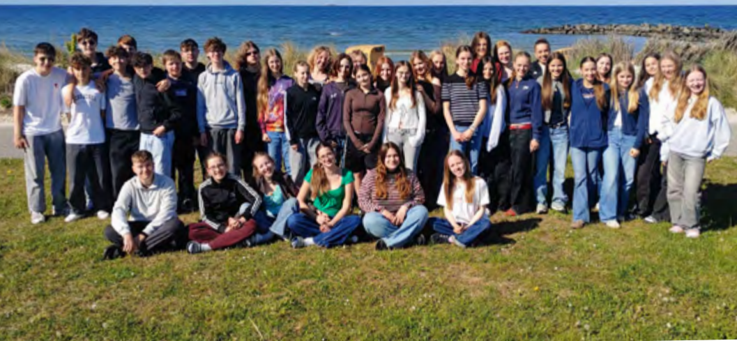
Letzter Termin für die JuHus vor der Jugendfeier: Die Abschlussfahrt nach Kalifornien an der Ostsee.