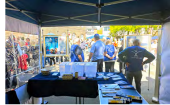
Erfolgreiche Präsenz: Beim Fest am 1. Mai kamen viele Interessierte an den Stand.

es wieder ein kleines und nicht ganz ernst gemeintes Quiz zum Thema Rentenversicherungsbeiträge. Mehr als 40 Stimmen wurden abgegeben. Die große Mehrheit war dafür, sie in ein umlagefinanziertes Rentensystem einzuzahlen.